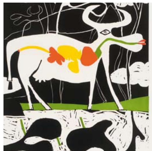
Autor: Samy Benmayor, obra: La vaca, fragmento, libro: Cuño y Estampa.