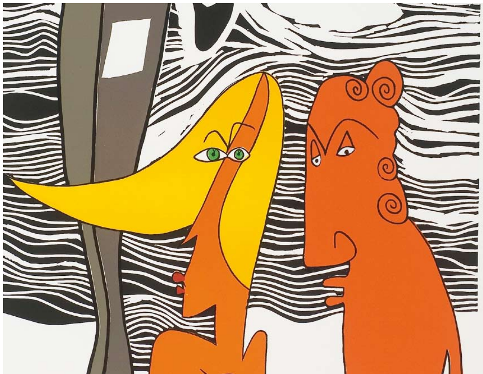
Autor: Samy Benmayor, obra: La suegra y la nuera, fragmento, libro: Cuño y Estampa.